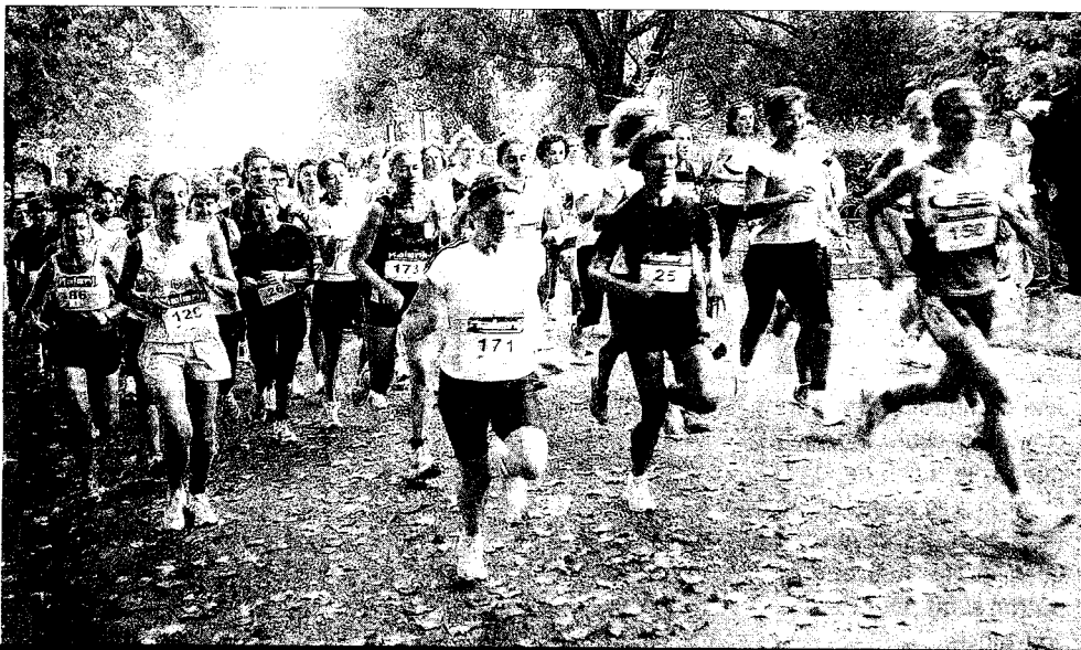
RECORD. Dimanche matin, parc Napoléon, à Vichy : 211 filles et femmes prennent le départ de la 6 e Vichyssoise : un record d'affluence pour les organisatrices. PHOTOS AURÉLIE PATÉREK

Sur les 211 partantes, 168 d'entre elles ont terminé le parcours de 10 kilomètres autour du plan d'eau en moins d'une heure.